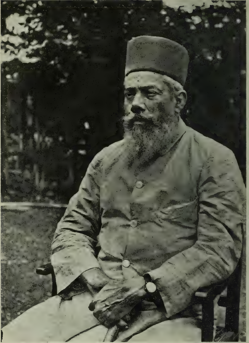
डॉ. बाळकृष्ण शिवराम मुंजे